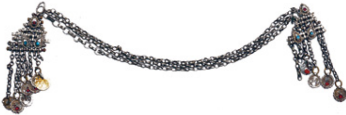
Նկ. 3. Քունքազարդ շղթայով, ոսկե ժեյրոնով: 19-րդ դար, Թիմար գավառակ: ՀՊԹ, 5050 - 1, 2