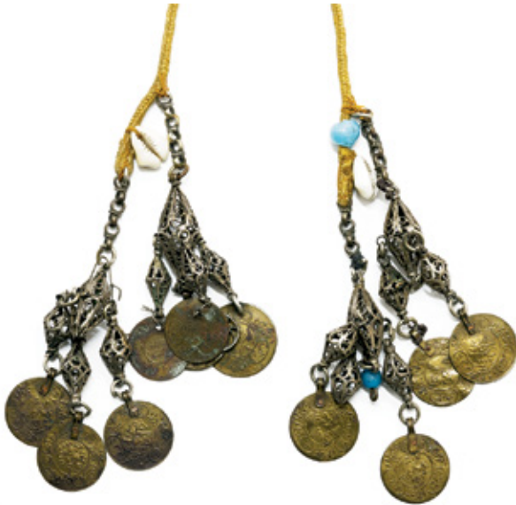
Նկ. 11. Ծամի զարդ՝ 1806 - 1807թթ. մեքադադրամներով: 19-րդ դարի սկիզբ: Վսն: ՀՊԹ, 6631: