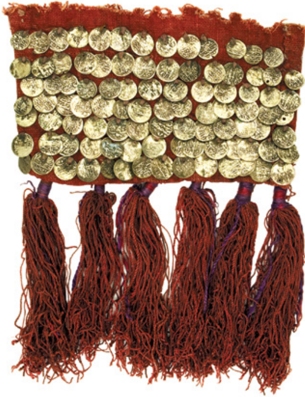
Նկ. 10. Հինայիլ - գոզնոց, դրամներով (գուրկարտեղից ցած կախվող)՝ օսմանյան մեքադադրամներով: 19-րդ դարի սկիզբ: ՀՊԹ, 4718