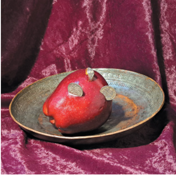
Նկ. 1. Նշանադրության նվեր՝ սկուրեղով մաքրուցվող խնձորի մեջ խրված մաարանի և մետրադատրամներ: