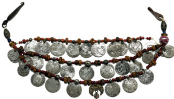
Նկ. 7. Վզնոց՝ ռուսական, օսմանյան, լեհական, պրուսական, ավարո-հոնդարական մետաղադրամներով: 19-րդ դար, գյուղ Գինեկանց, Մոկսի գավառակ, Վանի գավառ, Վանի նահանգ: ՀՊԹ, 6695