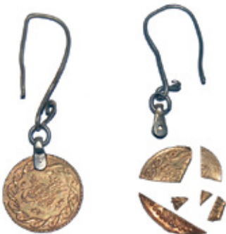
Նկ. 4ա. Ականջօղեր՝ ոսկե պիսասրններով 1808 - 1809 թթ., Պոլիս: ՀՊԹ, 7719-1