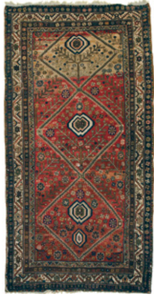
Նկ. 2. Գորգ օժիտի, 19-րդ դար: ՀՊԹ, 10743