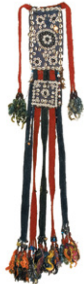
12. Հինայիլ-գոզնոց կանաչի, խեցիներով (գուրկարտեղից ցած կախվող): 19-րդ դարի սկիզբ: ՀՊԹ, 1512