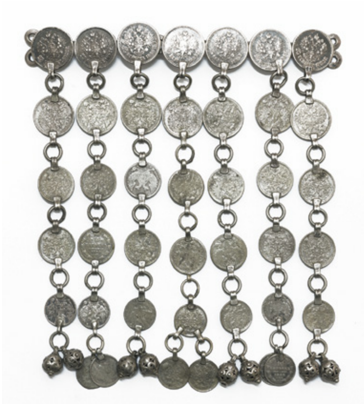
Նկ. 8. Կրծքագարդի՝ ճարմանդով և ռուսական դրամներով: 19-րդ դարի սկիզբ: Շառնադինի գավառակ (Տավուշ), Ղազախի գավառ, Ելիզավետպոլի նահանգ, ՀՊԹ, 6467