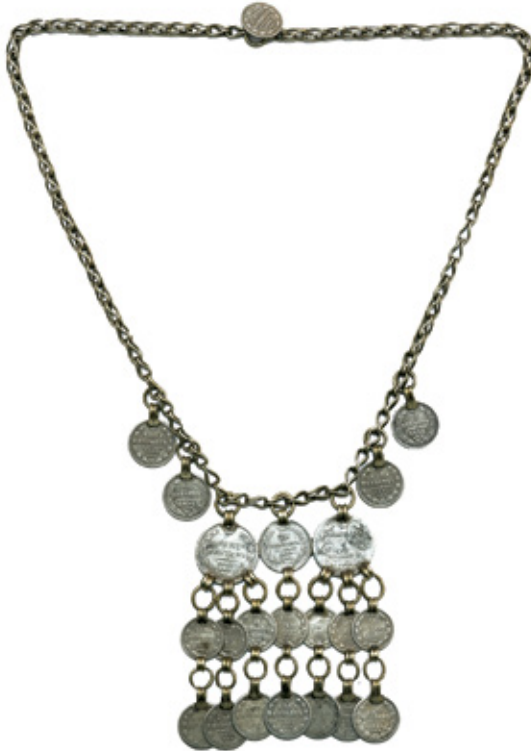
Նկ. 6. Վզնոց՝ ռուսական մետաղադրամներով: 19-րդ դար, Մոկսի գավառակ, Վանի գավառ, Վանի նահանգ: ՀՊԹ, 6688