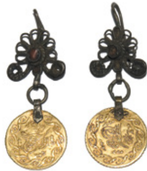
Նկ. 4բ. Ականջօղեր՝ ոսկե պիսասրններով: 1808 - 1809 թթ., Պոլիս: ՀՊԹ, 7719-2